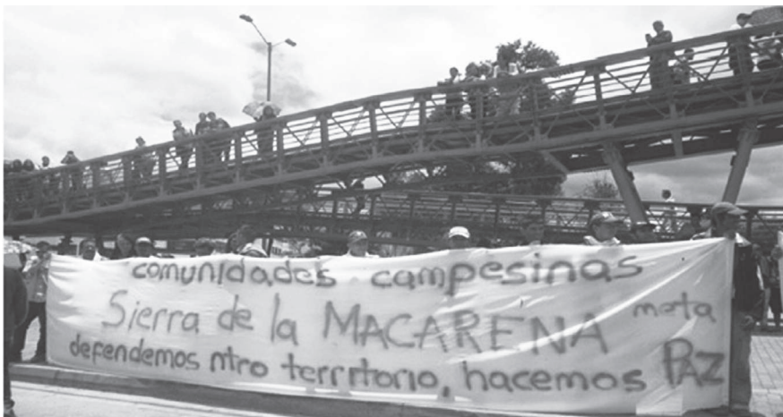
Foto 1. Marcha por la paz en Bogotá, 9 de abril de 2015.