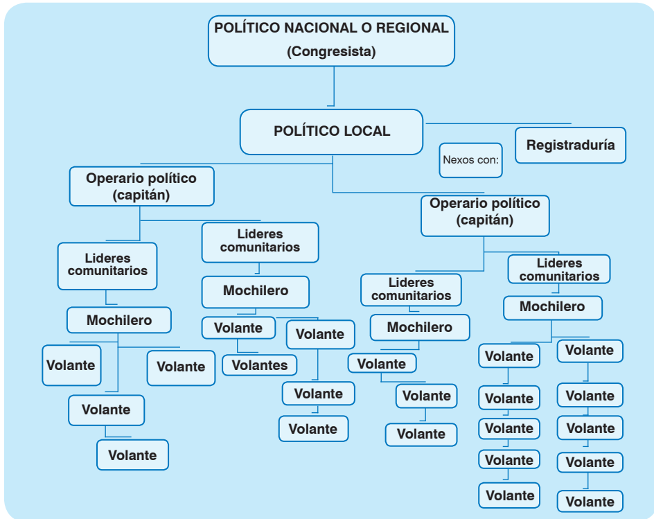
Gráfica 1. Componentes del entramado de la trashumancia electoral.

marcados con anticipación—; endosamiento de electores —compra colectiva de votos para un tercero—; y la trashumancia electoral .