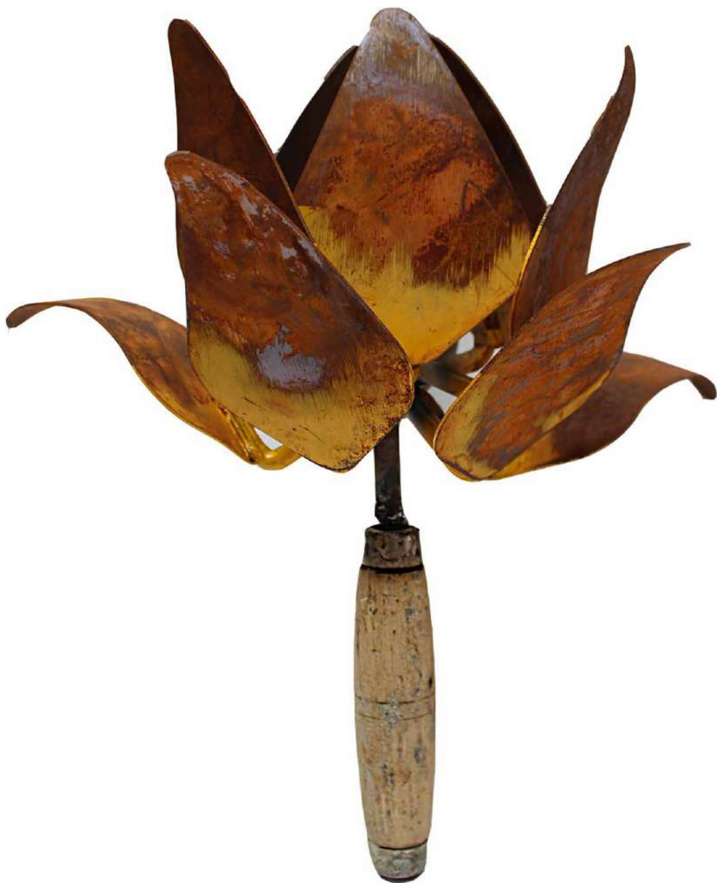
Yamith Quiroz David Nuevas vegetaciones IV De la serie El mito de flora Escultura, palustres de hierro, cabo de madera 38 x 23 x 15 cm 2020 Medellín