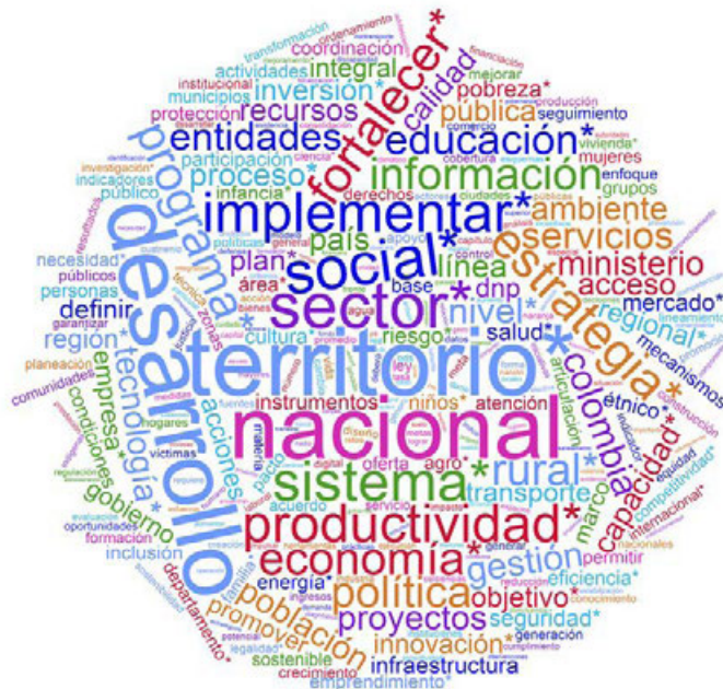
Figura 1. Nube con las palabras más frecuentes en el Plan Nacional de Desarrollo 2108-2022.

El primer resultado del análisis se aprecia en la figura 1, una nube de palabras que presenta de manera visual los términos más frecuentes en el PND. De esta manera, se observa que el término más frecuente en el PND es territorio . El término más pequeño que se lee en la nube de palabras es propiedad , y su frecuencia de aparición es 5% de la frecuencia encontrada para territorio . Términos con una frecuencia menor a la de propiedad no se incluyen en la nube de palabras.