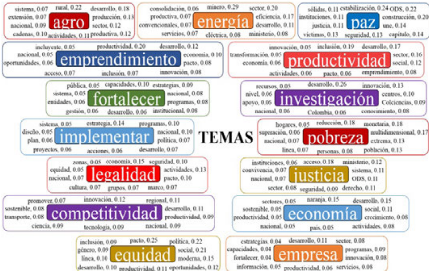
Figura 4. Vecinos cercanos al segundo grupo de quince temas del Plan Nacional de Desarrollo 2108-2022.

Fuente: elaboración propia a partir de DNP (2018).