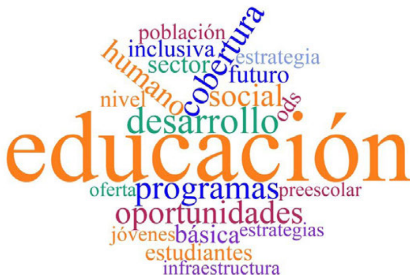
Figura 5. Vecinos cercanos al tema educación del Plan Nacional de Desarrollo 2108-2022.

Fuente: elaboración propia a partir de DNP (2018).