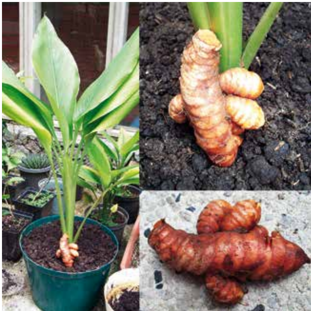
Rizomas de Curcuma longa L.

altas, un mínimo de 1000 mm de agua de lluvia anual con irrigación complementaria, altitud entre 1300 y 1800 msnm y suelos ricos en materia orgánica. Esto sin dejar de mencionar que la síntesis de metabolitos también se ve afectada (en clase y cantidad) por las condiciones en que se cultiva la planta, lo cual se traduce en una falta de homogeneidad en la obtención de los curcuminoides.