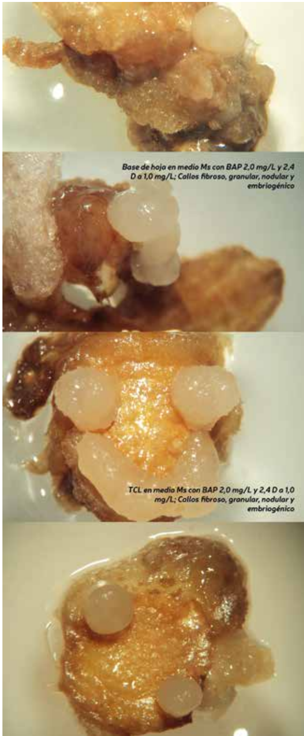
Callos embriogénicos de Curcuma longa L.

la formación de microrrizomas solo controlando el fotoperiodo, esto es a mayor número de horas de oscuridad, mayor número de microrrizomas.