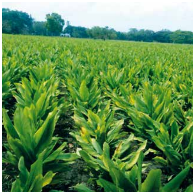
Campo de cultivo de Curcuma longa L.

Los compuestos que produce la planta, y que son responsables de la mayoría de sus propiedades y efectos farmacológicos, son conocidos como "curcuminoides". Otros compuestos de importancia en la actividad biológica son derivados sesquiterpenos, diarilheptanoides, alcoholes, cetonas y aceites esenciales.