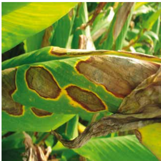
Planta de Curcuma longa L. con síntomas de Colletotrichum capsici

Todo esto, aunado a que a la fecha no se han reportado efectos indeseables, hace que la demanda mundial aumente constantemente, sin embargo la producción no alcanza a satisfacerla.