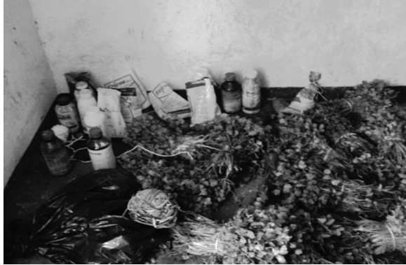
Figura 2. Almacenamiento de agroquímicos junto a cosecha de cilantro en un predio (Marinilla, 2011-2012)

los encuestados sobre los riesgos asociados a la manipulación de agroquímicos, se encontró que el 58% los conocían, principalmente la intoxicación (47%).