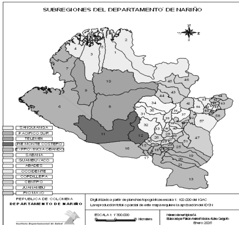
Figura 1. Las trece subregiones del Departamento de Nariño