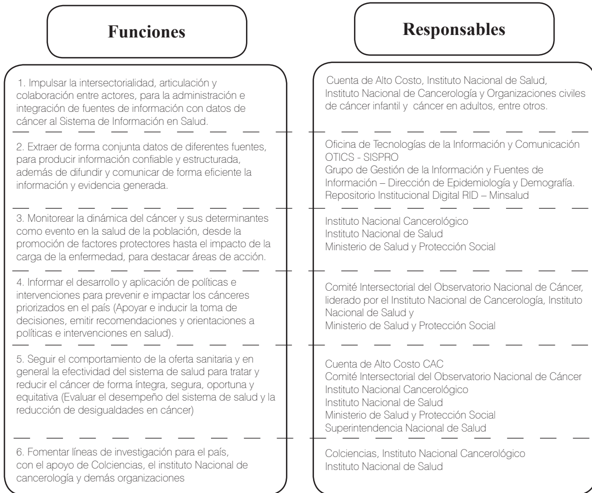
Figura 2. Funciones del Observatorio Nacional de Cáncer de Colombia

En consecuencia, el rol del observatorio es gestionar el conocimiento a partir de las fuentes conjuntas de información para abordar el cáncer como un problema de salud pública, y contribuir con la orientación de estrategias para reducir la carga de enfermedad y desigualdades sociales por esta causa en Colombia. La figura 2 ilustra las funciones del ONC Colombia con sus responsables.