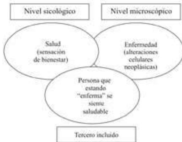
Figura 2. Proceso salud-enfermedad y tercero incluido

dos asuntos: por un lado, se requiere considerar niveles de realidad diferentes (para este caso, el nivel molecular o celular y el nivel psicológico), por otro lado, constatar que “lo que en un nivel único aparecería como antagonismo entre dos elementos contradictorios, al separar niveles, aquello que aparecía contradictorio está de hecho unido [...] y lo que aparecía como contradictorio deja de serlo”. 4 (Figura 2)