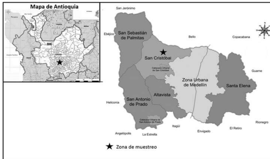
Figura 1. Zona de muestreo en el corregimiento de San Cristóbal, en el mapa de corregimientos del municipio de Medellín.

Se realizó un estudio de corte en el mes de junio del año 2017, en una muestra por conveniencia de 40 agricultores residentes en el corregimiento de San Cristóbal (véase Figura 1), a quienes se les tomó muestra sanguínea para medición de biomarcadores por el método de Michel, que permite evaluar las exposiciones crónicas a plaguicidas inhibidores de las CE, como organofosforados y carbamatos [28]. Los participantes fueron clasificados de acuerdo con el uso de plaguicidas o la práctica de la agroecología por autorreporte.