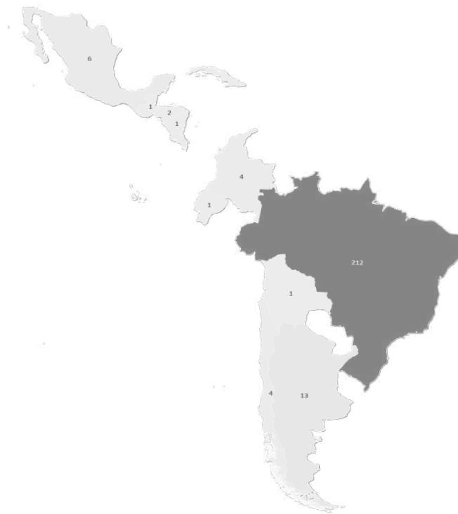
Figura 3. Distribución geográfica de las publicaciones.