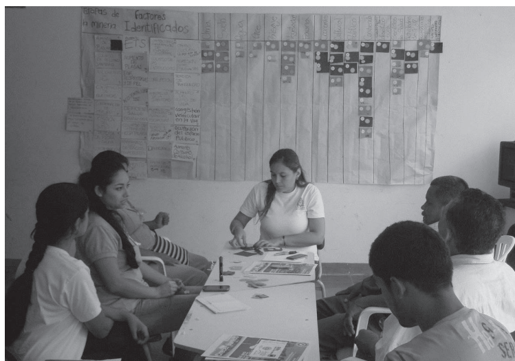
Figura 2. Matriz participativa de valoración de los impactos identificados por los líderes comunitarios, acorde con las ASPi y los FARI, Buriticá, Antioquia, 2014.

Para el análisis de la información se usó la metodología de la matriz de Leopold para la valoración de impactos, por su facilidad, sencillez y menor complejidad en los cálculos e interpretación. Para ello, se determinó el número de factores afectados por cada una de las acciones en las columnas de la matriz de valoración, y en las filas, el número de impactos que afectaban cada factor. El puntaje de los impactos es presentado en la matriz