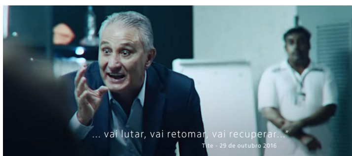
Foto 1. Cena do comercial “Preleção”, do banco Itaú, veiculado no dia 19 de março de 2018

Para Bakhtin, todo discurso se estabelece em diálogo com discursos anteriores, com os seus contemporâneos e também antecipando respostas futuras. O discurso de Tite é ilustrado no plano imagético por cenas de jogadores da seleção recebendo instruções, alternadas com imagens da vida cotidiana de brasileiros, nos mais diversos lugares do país, como na cidade e no campo. Jovens, velhos. Trabalhadores, estudantes, gente nas ruas, nos transportes públicos. Perfis variados. Classes distintas. Um sentido de universalidade, de que todos os brasileiros cabem ali, naquele espaço simbólico onde ecoam as mensagens de motivação, de inspiração. Todos unidos por uma voz só: a voz do técnico, do nosso Tite, elevado à categoria de coaching da alma brasileira, quando diz que “O complexo de vira-lata eu já tive: agora não...” (6/8/2017); “Tudo que tá no passado é história” (15/9/2017); “Nós trabalhamos muito para chegar nesse estágio...” (29/10/2016); e a mais simbólica de todas as frases: “Acreditem em mim... vai lutar, vai retomar, vai recuperar...” (29/10/2016) (Figura 1).