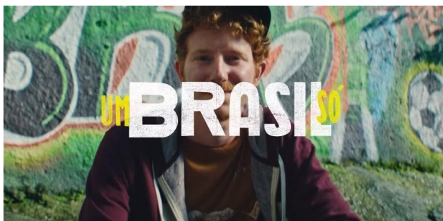
Foto 2. Cena do comercial “Preleção,” do banco Itaú.

Como discurso parcialmente aberto a interpretações, os implícitos se acumulam. O que não parece permitir leituras dissonantes é a assertiva de que “o Brasil é um só”. “Nós atingimos uma nova etapa... A gente passa a página e a partir de agora... somos um Brasil só, em busca do mesmo objetivo...”, é o que diz Tite no comercial. O final do filme, em tom orquestral, grandiloquente, como uma apoteótica fanfarra para o homem comum 15 , mostra uma galeria de imagens, de brasileiros encarando os interlocutores, a audiência, como uma espécie de convocação. Sobrepostas a essas imagens, as frases: “Um sentimento só. Um Brasil só. #issomudaojogo” (Figura 2).