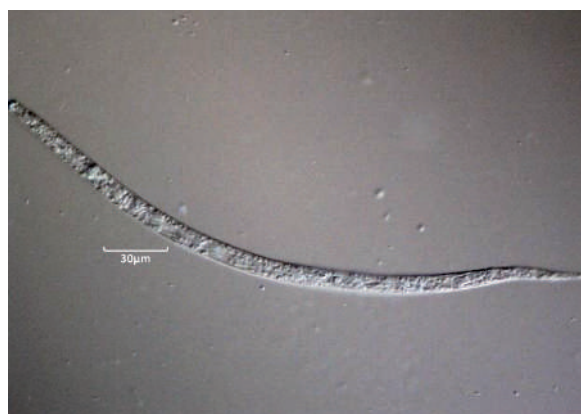
Figura 4. Nematodo. In vivo 100x Óptica de Contraste Interdiferencial (DIC). Cuerpo en forma de cordón con simetría bilateral. Posee un número variable de células, las cuales conforman tejidos internos y órganos especializados.

Fotografías tomadas con microscopio Nikon Eclipse 90i en un aumento de 40X utilizando óptica Nomarski u óptica de Contraste Interdiferencial (DIC, por sus siglas en inglés), esta es una técnica de microscopía de luz que emplea filtros polarizantes y prismas para producir imágenes tridimensionales.