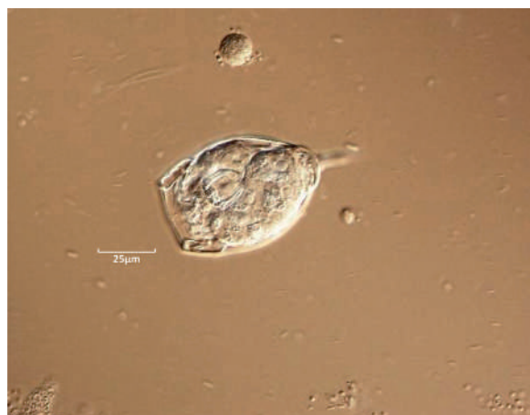
Figura 3. Rotífero Lecane sp. In vivo 400x. Óptica de Contraste Interdiferencial (DIC). Cuerpo redondeado con caparazón externo en dos placas y pie con un dedo para sujeción.

co. Se alimentan principalmente de bacterias de vida libre presentes en el medio y es bioindicador de una adecuada oxigenación en los tanques de aireación de las plantas de tratamiento de aguas residuales