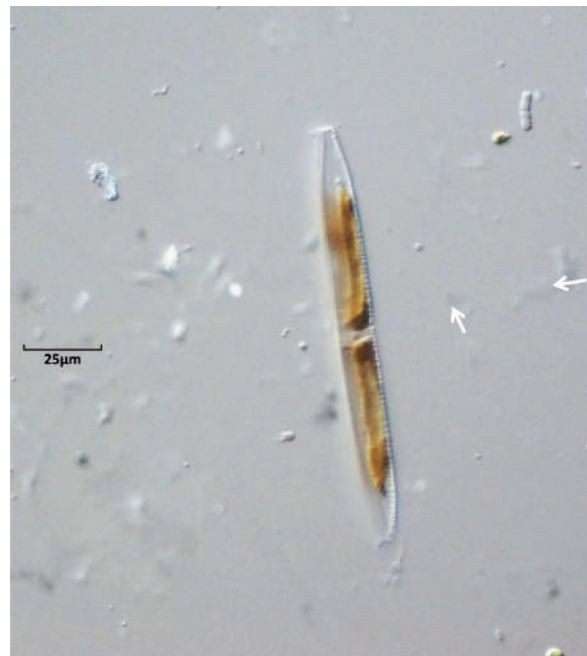
Figura 1. Nitzschia sp. In vivo , 400x.

Oscillatoria sp. al igual que algunas diatomeas no es un individuo, en realidad el filamento es una colonia formada por decenas de ellos perfectamente alineados, en el que cada tramo delimitado por una línea gruesa marca la frontera entre un individuo y otro, una frontera que se rompe en el trabajo común que llevan a cabo en la búsqueda de la radiación solar (figura 2).