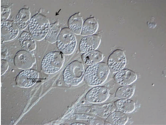
Figura 5. Vorticella sp. In vivo , 200x. Óptica de Contraste Interdiferencial (DIC). Ciliado sésil con forma oval, presenta una vacuola contráctil próxima al borde peristomial.