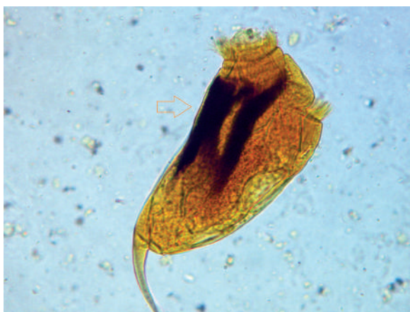
Figura 2. Orden Entodiniomorphida. Epidinium caudatum . Presencia de 3 placas esqueléticas.

creción y alimenticia) (figura 4), vestíbulo o citostoma y citopigio se observan entre integrantes de los dos órdenes, variando en tamaño, forma y posición según el género, especie o subespecie. El tamaño y la forma del protozoo son claves taxonómicas importantes para la identificación al igual que el número y posición de las zonas ciliares. Los ciliados del orden Entodiniomorphida se caracterizan por tener 1, 2 ó 3 zonas ciliares (figura 5), a diferencia del orden Vestibuliferida quienes presentan cilios somáticos y uniformes (figura 1). 1,6 Al presentarse en el orden Entodiniomorphida la mayor diversidad se hace provecho de las placas esqueléticas como estructura clave para la identificación de los protozoos de este orden. Estas placas están au-