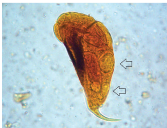
Figura 4. Epidinium caudatum . Vacuolas.