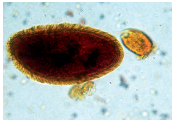
Figura 1. Orden Vestibuliferida. Isotricha sp. cilios somáticos uniformes.

zoaria. 1 Variadas investigaciones en nutrición animal han evaluado dietas y su relación con poblaciones de protozoarios ciliados, no obstante la caracterización de estos ciliados se ha agrupado generalmente en dos grupos: los llamados holotricos (orden Vestibuliferida) (figura 1) y entodiniomorfos (orden Entodinio-