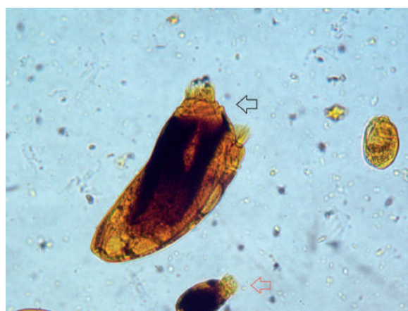
Figura 5. Epidinium ecaudatum (2 zonas ciliares). Entodinium sp. (1 zona ciliar).