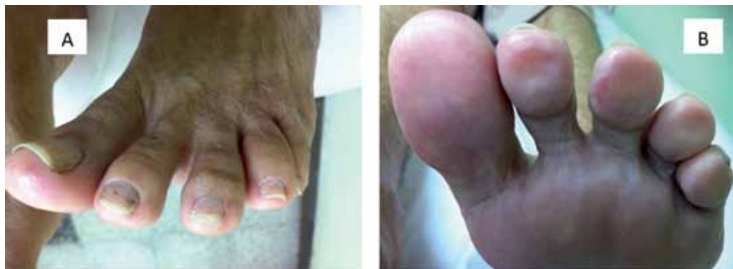
Figura 3. Seguimiento a los ocho meses con mejoría completa de las lesiones cutáneas. A. vista dorsal. B. Vista plantar