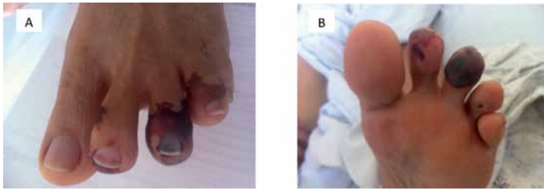
Figura 1. Lesiones purpúricas distales en el pie izquierdo. A. Vista dorsal. B. Vista plantar