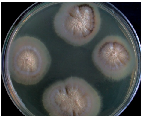
Figura 1. Cultivo a 25 °C. Colonias glabras, húmedas, de color habano