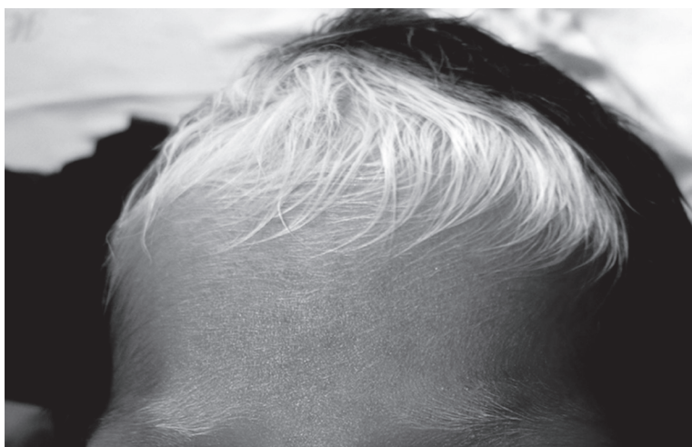
Figura 3. Se observa el compromiso de la región medial de los supercilios