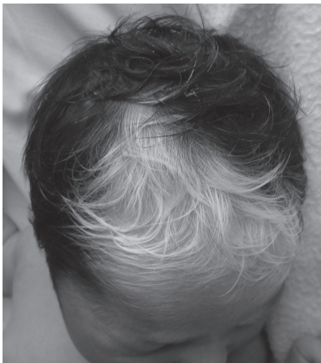
Figura 1. Poliosis de la zona media central

Nacimiento sin complicaciones por vía vaginal a las 38 semanas de gestación. Medidas antropométricas normales. Al examen físico se encontró poliosis de la zona media central (mechón de pelo blanco frontal con hipopigmentación bilateral de la región medial de los supercilios, sin comprometer las pestañas). Además, desviación de la comisura labial hacia la derecha, que sugería parálisis facial (figuras 1, 2 y 3). Se efectuó prueba de potenciales evocados auditivos que resultó normal.