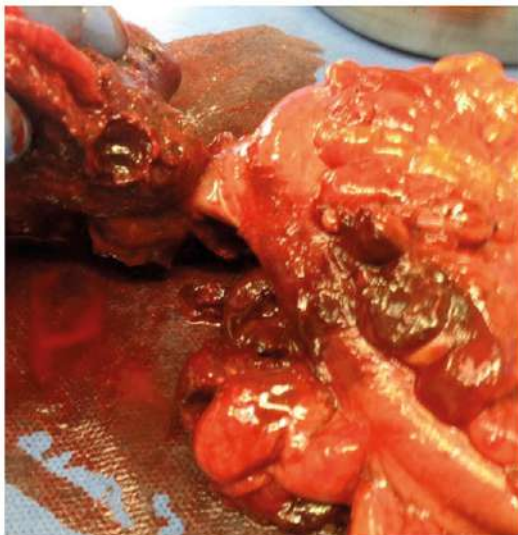
Figura 2. Pieza quirúrgica. Colon sigmoides con divertículo antimesentérico y un gran hematoma mural.

Se realiza el drenaje del hemoperitoneo, sigmoidectomía que deja los extremos intestinales cerrados. Empaquetamiento abdominal del flanco izquierdo por coagulopatía y se decide dejar con el abdomen abierto, con el cierre temporal de la pared abdominal. El paciente nuevamente es intervenido a las 72 horas, una vez mejoraron sus condiciones hemodinámicas. Se realiza el desempaquetamiento abdominal, colostomía tipo Hartmann del colon descendente y el cierre definitivo de la pared abdominal. El paciente presenta un ileo postoperatorio prolongado que requirió el inicio nutrición parenteral total. Se inició tratamiento antibiótico por bacteriemia asociada al catéter venoso central por Pseudomonas Aeruginosa . Por el hallazgo al ingreso de trombocitopenia se realiza biopsia hepática que reporta esteatohepatitis y se descartaron enfermedades infecciosas. Se realizó el aspirado de la médula ósea con médula hematopoyética normal, sin cambios significativos en la citometría de flujo y 3 líneas celulares normales. Debido a la persistencia de la trombocitopenia, a pesar de la resolución del sangrado intraabdominal agudo y el