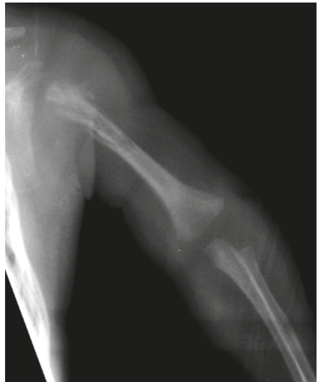
Figura 3. Radiografía del brazo izquierdo. Periostitis epífisodiafisaria del húmero, destrucción metafisaria y cortical con elevación perióstica.

Dada la extensión de la afección el paciente no era candidato para el manejo quirúrgico. Se optimizó la analgesia con opioides y antiinflamatorios, además, recibió cinco semanas de vancomicina, continuando con dos más de clindamicina, para un total de siete