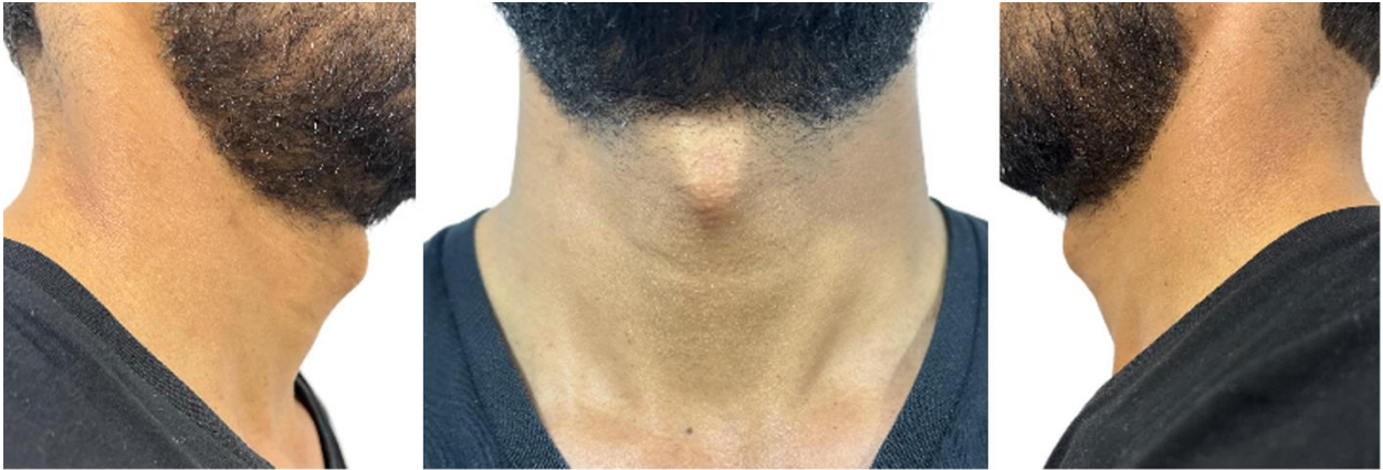
Figura 1. Imágenes de cuello en vista lateral y frontal

cuello desencadenantes del clic, se evidencia movimiento brusco y salto de la laringe. El resto del examen físico está dentro de rangos de normalidad ( Video 1 ).