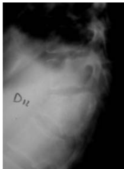
Figura N° 2 COLAPSO DEL CUERPO VERTEBRAL POR TUBERCULOSIS

El tiempo de evolución de los síntomas antes del diagnóstico osciló entre 1-60 meses, con un promedio de 8.9 meses.