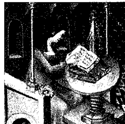
WOMAN TEACHING, Giovanni Boccaccio - September 1