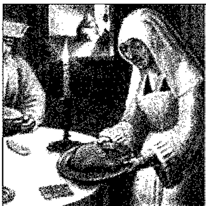
WAITING ON TABLE, The da Costa Hours • December 25 (Serie de cuatro fotos, detalles)

La enfermedad es expresión de la relación con la sociedad, con el grupo familiar y con el poder. El proceso mórbido es también producto de la confrontación entre lo tradicional y lo moderno, lo propio y lo extraño en cada individuo, así como de su relación con quienes construye el mundo subjetivo que les es común y a partir del cual se identifican como grupo y se diferencian de los demás. Estas son concepciones que se expresan y materializan en las prácticas médico-culturales. En esta cultura, el mantenimiento de la salud y la presentación y recuperación de la enfermedad hasta su curación, dependen en gran medida de la tenencia o carencia de alimentos. Para estas personas hay alimentos medicinales y medicinas alimenticias. Son muy importantes los alimentos en la enfermedad y de acuerdo con la enfermedad se utilizan. En el caso específico del paludismo por ejemplo, “están prohibidos algunos alimentos dependiendo del paludismo que sea”.