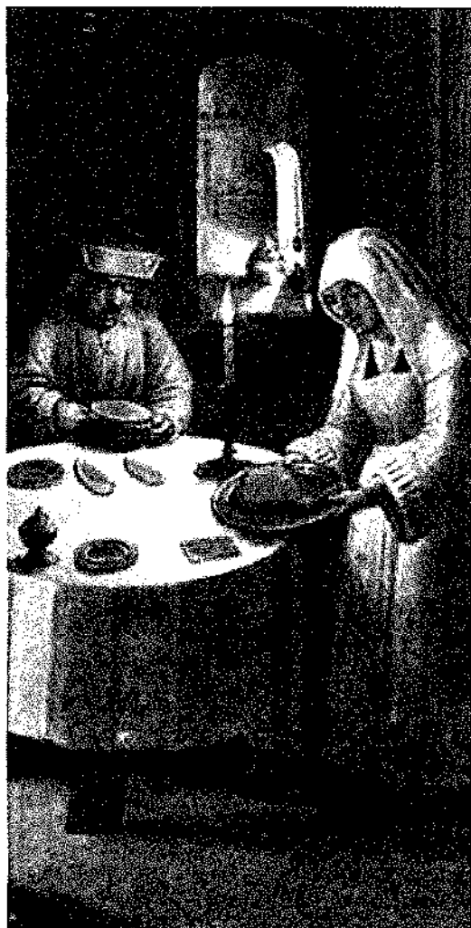
WAITING ON TABLE, The da Costa Hours - December 25