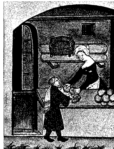
SELLING BREAD, Tacuinum Sanitatis - January 13

6 Es el sabor y el olor a mar, sabor fuerte a pescado.