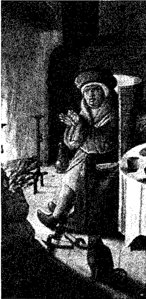
WAITING ON TABLE, The da Costa Hours - December 25

La cultura afroamericana clasifica las enfermedades a partir de principios opuestos (lo frío, lo caliente; lo amargo, lo dulce), e iguales categorías utiliza para clasificar los cuerpos, los alimentos y la terapéutica, sea esta con medicamentos o con plantas. La dinámica del proceso salud-enfermedad se sustenta en la relación de los opuestos, en la relación hombre-mujer, en el equilibrio de lo doméstico y lo salvaje, de lo caliente y lo frío. Así, la malaria es un proceso mórbido caliente, con una causalidad salvaje mediante el contacto humano-vector-selva y tratado con plantas frescas y amargas, que se cura con el tratamiento femenino que domestica las plantas y las opone para lograr el equilibrio, la armonía, la salud. ●