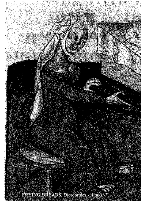
FRYING BREADS. Diocorides - August 7