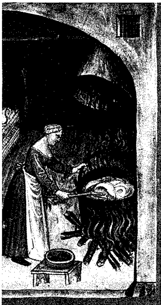
PREPARING AND COOKING TRIPE, Tacuinum Sanitatis - March 7

En la cuenca del río Valle se observa una estrecha relación entre los componentes del proceso agroalimentario (producción-recolección y cultivo y distribución de alimentos, preparación y consumo de comidas), concebido como una tarea colectiva del grupo doméstico o realizada en unión con otras familias de vecinos. Estas actividades están integradas en el quehacer de todos y en sus roles de hijos, esposos, padres, suegros o abuelos, o sea con referencia a la edad, al sexo y a las relaciones de parentesco o afinidad.