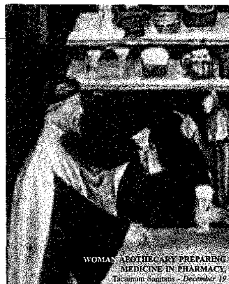
WOMAN APOTHECARY PREPARING MEDICINE IN PHARMACY. Tacuinum Sanitatis - December 19