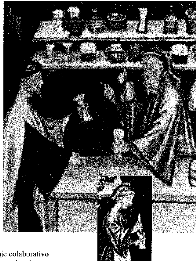
WOMAN APOTHECARY PREPARING MEDICINE IN PHARMACY, Tacuinum Sanitatis - December 19

Gran énfasis se ha dado al autoaprendizaje y al aprendizaje colaborativo como una metodología que permite el desarrollo de variados aspectos de relevancia en la formación del licenciado. Se estimula la búsqueda y selección de información, la responsabilidad en la organización del tiempo de estudio, la autonomía, la autoestima y el reconocimiento de las fortalezas y limitaciones en formas de lograr un aprendizaje significativo. Muy relacionado con lo anterior está el desarrollo de la capacidad de liderazgo y del pensamiento crítico y reflexivo, dos aspectos que deberían ser logrados en todos los egresados. Los nuevos paradigmas para estimular estas características y permitir el desarrollo del potencial que aporta el estudiante son la participación activa en el ABP, el análisis grupal de situaciones clínicas, la metodología de solución de problema y la participación temprana en actividades científicas y gremiales organizadas por los mismos estudiantes.