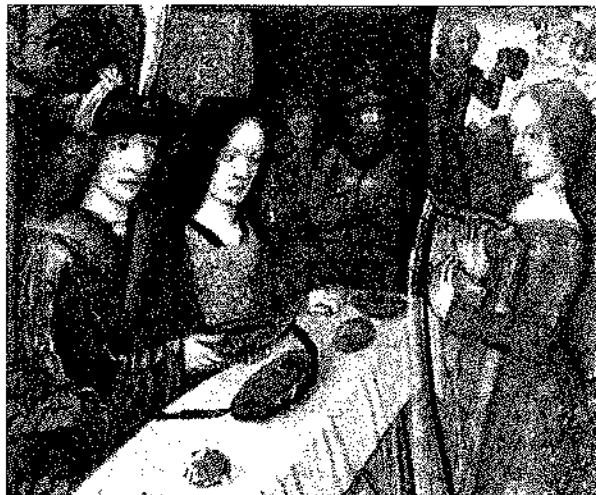
WOMAN ENTERTAINER. Book of hours - February 7 (detail)

Como ejemplos de programas estratégicos de complejidad importante, de larga duración y diseñados mediante la aplicación de metodologías establecidas para la elaboración de proyectos, se tiene la experiencia de los Proyectos UNI en América Latina adelantados con el respaldo de la Fundación W.K.Kellogg, de los cuales varios se realizan en Brasil. En Colombia se han desarrollado tres y todos ellos han dejado frutos importantes para tomar en cuenta como experiencias de extensión. En estos proyectos se reconoce la esencia académica de la extensión y se incorporan los referentes conceptuales planteados al comienzo; son ante todo de naturaleza académica. Es de resaltar las relaciones que se concretan entre la universidad, el sector salud y la comunidad, ésas materializan una alianza estratégica que busca el beneficio de los tres socios con el aprovechamiento de los recursos y desarrollos de cada uno, las contribuciones a los modelos pedagógicos de los programas de la salud participantes, el mejoramiento del sector salud, el desarrollo de la organización comunitaria, gestión realizada con el reconocimiento y el debido respeto a los desarrollos y a la autonomía de cada partícipe del proyecto.