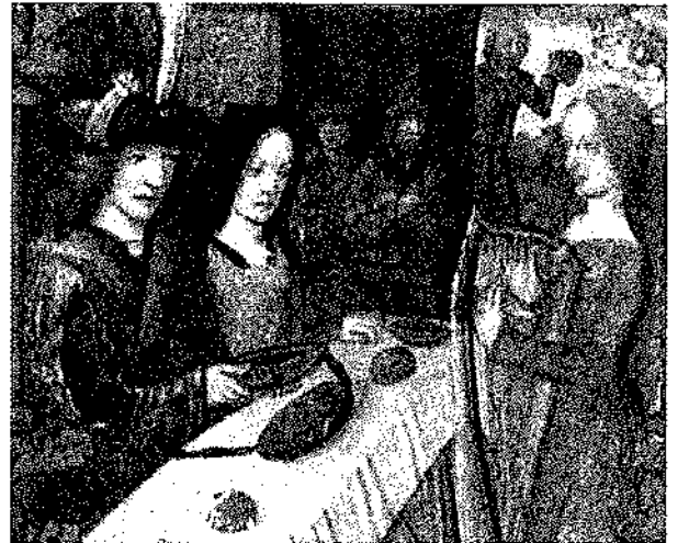
WOMAN ENTERTAINER, Book of hours - February 7 (detail)

Como ejemplos de programas estratégicos de complejidad importante, de larga duración y diseñados mediante la aplicación de metodologías establecidas para la elaboración de proyectos, se tiene la experiencia de los Proyectos UNI en América Latina adelantados con el respaldo de la Fundación W.K.Kellogg, de los cuales varios se realizan en Brasil. En Colombia se han desarrollado tres y todos ellos han dejado frutos importantes para tomar en cuenta como experiencias de extensión. En estos proyectos se reconoce la esencia académica de la extensión y se incorporan los referentes conceptuales planteados al comienzo; son ante todo de naturaleza académica. Es de resaltar las relaciones que se concretan entre la universidad, el sector salud y la comunidad, ésas materializan una alianza estratégica que busca el beneficio de los tres socios con el aprovechamiento de los recursos y desarrollos de cada uno, las contribuciones a los modelos pedagógicos de los programas de la salud participantes, el mejoramiento del sector salud, el desarrollo de la organización comunitaria, gestión realizada con el reconocimiento y el debido respeto a los desarrollos y a la autonomía de cada partícipe del proyecto.