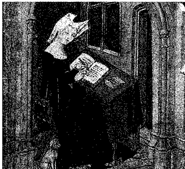
CHRISTINE DE PISAN, WRITING. Collected works of Christine de Pisan - July 13 (detail)