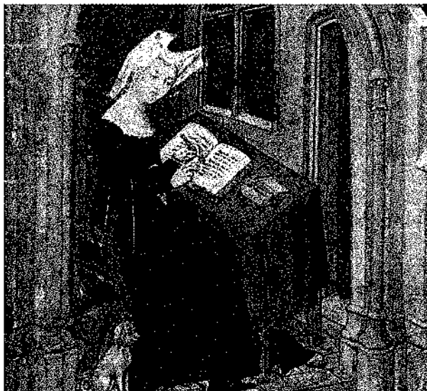
CHRISTINE DE PISAN, WRITING, Collected works of Christine de Pisan - July 13 (detail)