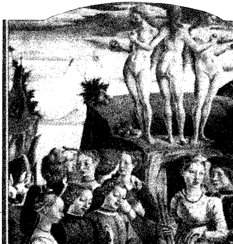
YOUNG COUPLES ENCOURAGED BY THE THREE GRACES - September 1

Según la igualdad todos los seres humanos deben recibir lo mismo, ya que tienen iguales derechos, sin distinción de raza, sexo, nacionalidad, credo religioso o filiación política. Desde la equidad cada cual debe recibir según sus necesidades y cada cual debe dar según sus capacidades y preparación.