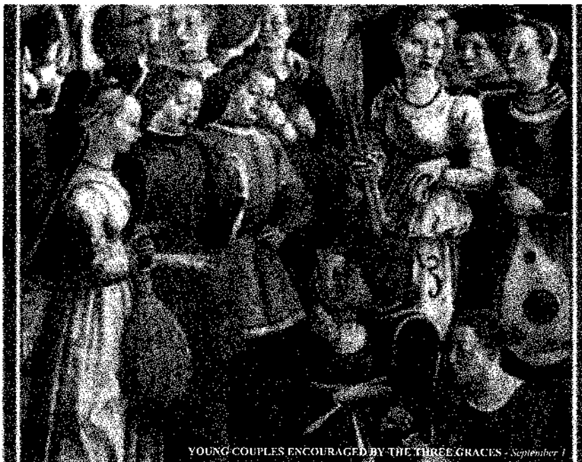
YOUNG COUPLES ENCOURAGED BY THE THREE GRACES - September 1

las demás personas como fines en sí mismos y por nosotros mismos, por lo cual evitamos tratar a los demás únicamente como medios e impedimos que otros lo hagan con nosotros, aspecto muy importante en el cuidado y en el trabajo con otros profesionales en el equipo de salud. 7