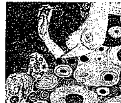
Gustav Klimt. La esperanza II , 1907-1908. Óleo y oro sobre lienzo, 110 x 110 cm Colección The Museum of Modern Art, Nueva York

No poder ser la misma. El embarazo o los cambios que él conlleva, se convierten en sucesos inesperados en la vida de la adolescente. Esto implica una discontinuidad en el tiempo y en el espacio, es decir, que la adolescente no puede