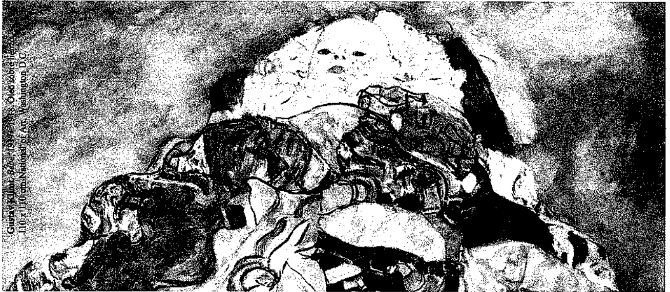
Guiray, M. (1998). Óleo sobre lienzo . 110 x 130 cm. National of Art, Washington, D.C.

Al sentirse apoyada por aquellos que le son significativos, la joven tiene la posibilidad de hablar sobre su embarazo, se siente escuchada. Esto significa, como lo afirma Jones, (28) un ordenamiento de la experiencia a través del lenguaje, lo que puede tener un gran significado de supervivencia y sentido de control.