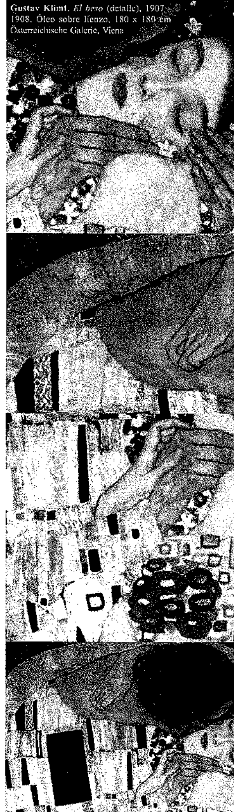
Gustav Klimt, El beso (detalle), 1907-1908. Óleo sobre lienzo, 180 x 180 cm. Österreichische Galerie, Viena

Para las adolescentes, el concepto de su cuerpo es especialmente importante, debido al proceso de construcción de identidad sexual que llevan a cabo. La joven en embarazo sufre transformaciones en su cuerpo físico causadas por su