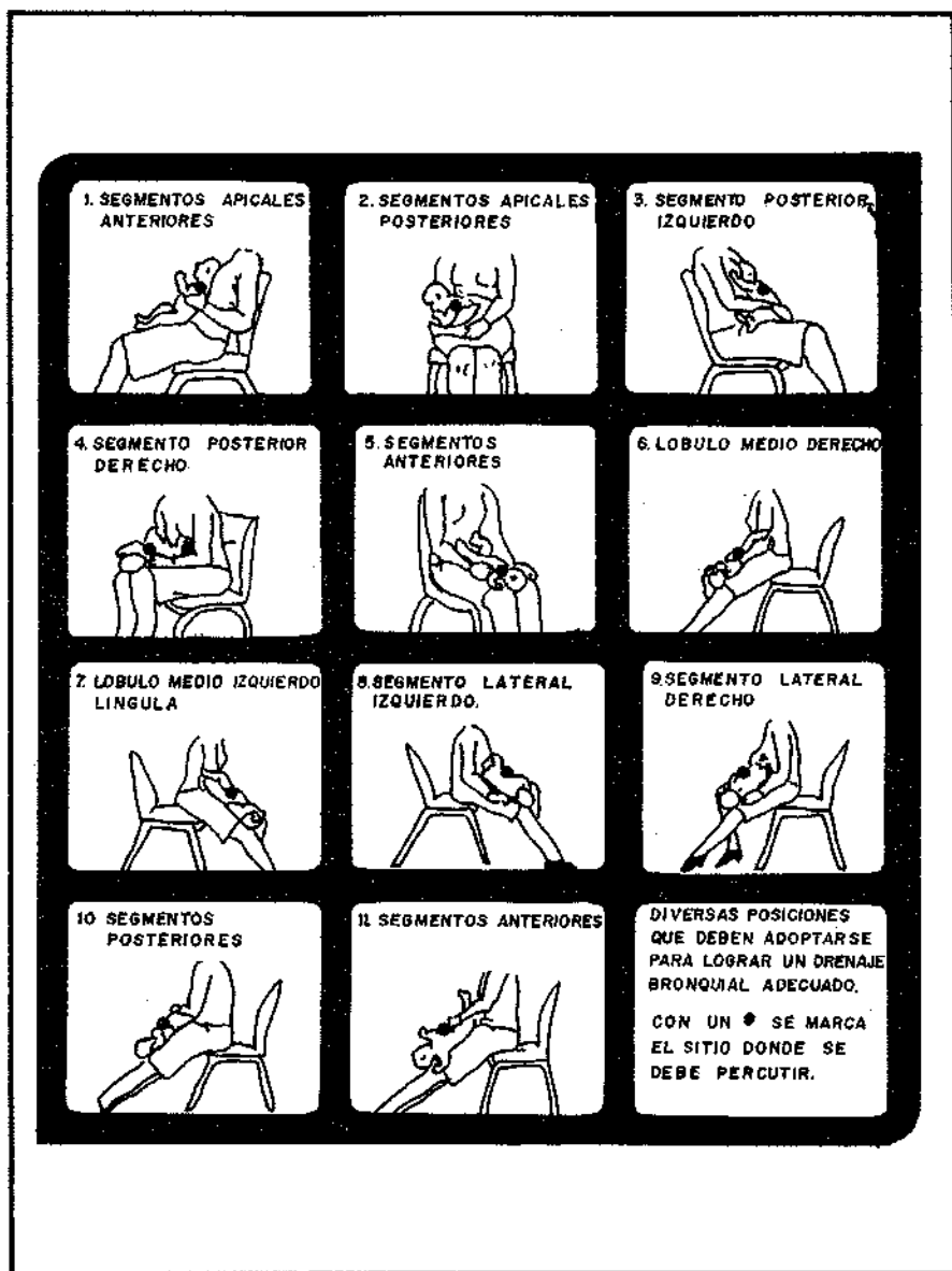
(10) Tomado de: Arellano, P. Mario. Cuidados intensivos en Pediatría 2o. Ed. Interamericana México 1982 pag. 91.