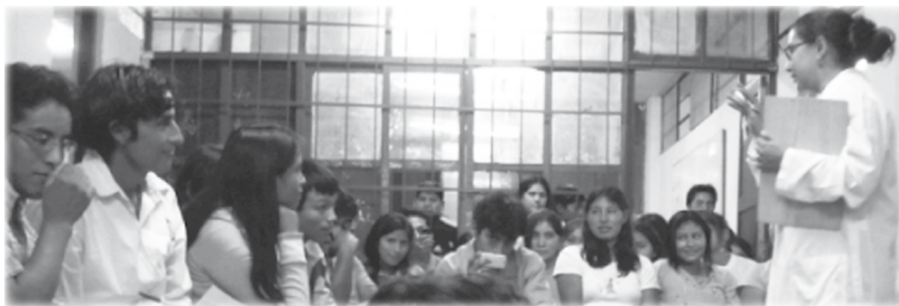
Fotografía: Hablando de sexo.