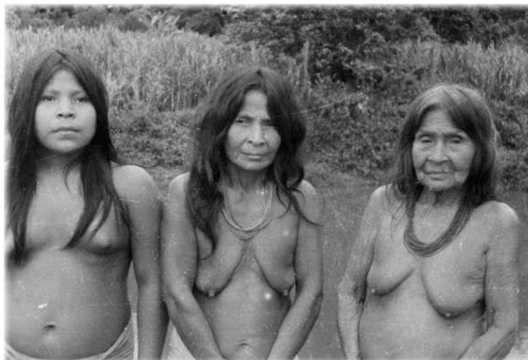
Mujeres indígenas del Chocó.

Esta etapa involucra tratamientos agresivos y mutilantes que producen desequilibrios de todo tipo y despiertan los fantasmas. Es importante reconocer al ser humano, no como una suma de partes, sino como un ser holístico, donde cualquier cambio en una de sus dimensiones afecta en mayor o menor grado a las demás, de tal manera que el desequilibrio físico que se manifiesta en cambios fisiológicos y corporales repercute a nivel mental, emocional y social. Estos desequilibrios pueden convertirse en potencialidades para la adaptación, en la medida que las estimula a reequilibrarse constantemente. Para adaptarse emprenden una lucha por estar bien, caracterizada por un trabajo de fortalecimiento integral para vencer la enfermedad.