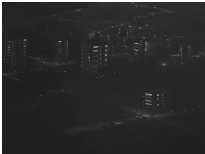
Vacios ausentes Nocturno fragmento, 180 x 120 cm