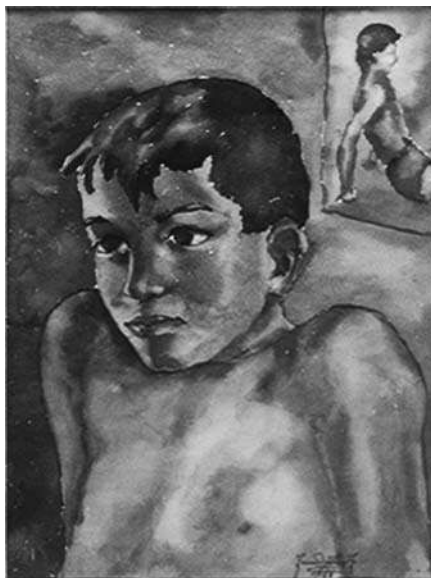
1958. Niño de medio cuerpo. 35 x 50 y 69 x 82

El autor refería en 1989, frente a la abstinencia post-parto, que, los hombres Suruí observan algunas veces la práctica de la couvade . El nuevo padre no está lejos. Su esposa y recién nacido permanecen en una pequeña casa que él construye para el parto en las inmediaciones de la aldea. Solamente él los visita. El autor observó que muchos hombres no seguían la dieta especialmente prescrita y duda de que ellos estuvieran preocupados con la observancia a este tipo de restricción en sus actividades sexuales o ellos eviten contactos extramaritales. De acuerdo con la información Suruí, los padres están cortejando mujer justo después del nacimiento de sus hijos. Otro Suruí hizo un comentario similar intentando explicar porqué muchos niños morían tempranamente. De acuerdo con ellos, un hombre no puede relacionarse sexualmente antes de que el niño esté gateando, o aún mejor, caminando. Dicho informante reconoció que muchos están rompiendo esta regla y de ahí el alto número de muertes infantiles, que reflejaban los cambios en el comportamiento sexual de los hombres Suruí. El impacto se da en aumento de la fecundidad, y, no continuar con la couvade puede afectar la sobrevivencia de los niños como un todo.