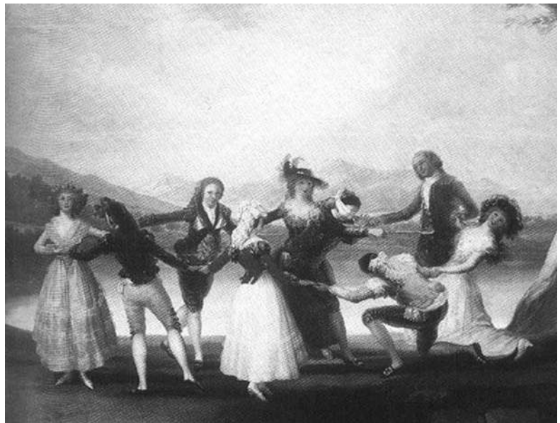
Goya, Francisco de José de La gallina ciega , 1791. Óleo sobre lienzo, 269 x 350 cm. Museo del Prado, Madrid

El monitoreo epidemiológico como propuesta metodológica ofrece desentrañar las relaciones que determinan procesos generales, particulares y singulares en aquellos entornos donde los seres humanos viven y tejen relaciones. El análisis desde los servicios de salud favorece la comprensión de esta urdimbre de relaciones y facilita la planeación y ejecución de los procesos investigativos que se deben liderar desde las prácticas clínicas y comunitarias.