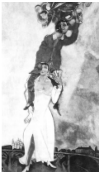
Marc Chagall. Doble retrato con vaso de vino (Bell y Marc), 1917. Óleo sobre lienzo, 235 x 137 cm París, Musée National d'Art Moderne, Georges Pompidou