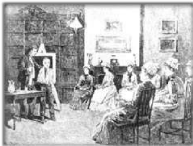
Una lección de vendaje. La sala de la casa de enfermeras del Bellevue Hospital en 1882. Grabado en madera. De Century Magazine, noviembre de 1882, en "Una nueva profesión para las mujeres". National Library of Medicine, Bethesda, Maryland.

La universidad se encuentra ante el desafío de hacerse presente en una sociedad veloz, caracterizada por la información sin fronteras, por la mundialización de las tensiones, por la acelerada acumulación de capital y por las crecientes diferencias y desigualdades