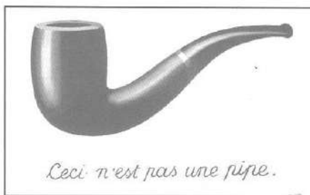
RENÉ MAGRITTE. La tradición de los imágines. (Esto no es una pipa) 1928/29. Óleo sobre linzo, 62,2 x 51 cm Los Angeles, County Museum

En relación con este aspecto un estudiante del VIII semestre de enfermería, escribe la siguiente experiencia de cuidado y la denomina