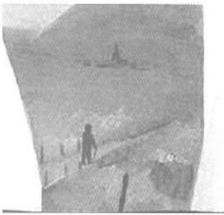
RENÉ MAGRITTE. idealist / La ventura . 1925. Óleo sobre lienzo. 65 x 50 cm. Brussels, colección privada