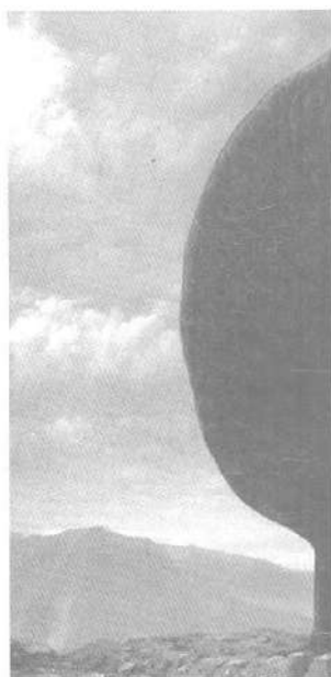
RENÉ MAGRITTE, (detalle) El plano del áreo , 1941 Óleo sobre lienzo, 73,7 x 100 cm Colección privada

El profesional, independientemente de su especialidad, debe demostrar amplitud de conocimiento, pluralismo de ideas, cultura vasta, lo que le proporciona una visión que trasciende el manejo técnico de la disciplina y el desarrollo de todas aquellas aptitudes y características que le permiten alcanzar la identidad profesional, posicionarse como tal en la sociedad, y alcanzar reconocimiento. Debemos recordar que los logros no son fortuitos, sino la culminación de los procesos. Hoy se recuerdan, estudian y reconocen autores como Dostojévski, Camus, Kafka, porque enaltecieron la literatura y en ella alcanzaron logros que en