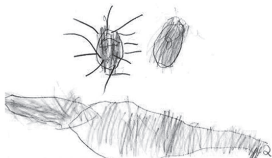
Figura 3. Dibujo libre de Cravo, 7 años