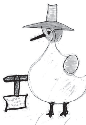
Figura 2. Dibujo libre de Orquídea, 9 años