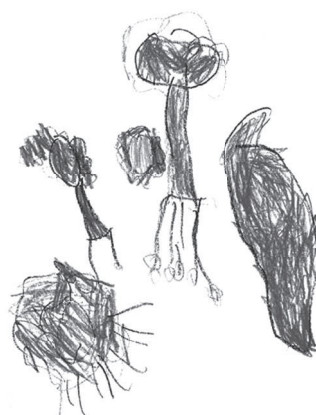
Figura 4. Dibujo libre de Cravo, 7 años