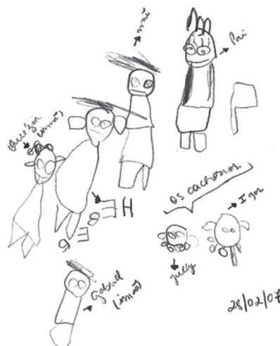
Figura 6. Dibujo libre de Margarida, 6 años