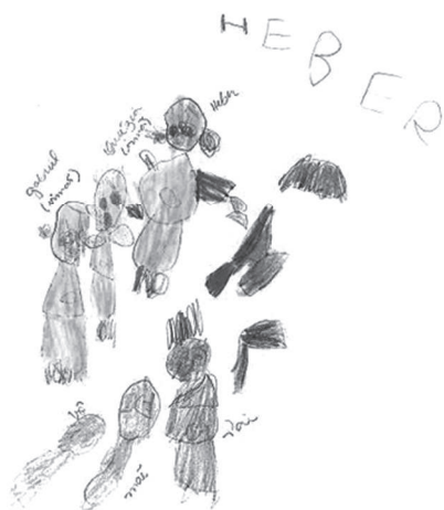
Figura 5. Dibujo libre de Margarida, 6 años