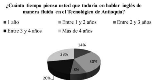
Figura 3 Ítem 4: ¿Cuánto tiempo piensa usted que tardaría en hablar inglés de manera fluida en el Tecnológico de Antioquia?