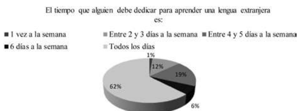
Figura 2 Ítem 3: El tiempo que alguien debe dedicar para aprender una lengua extranjera es...