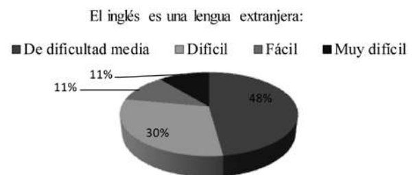
Figura 1 Ítem 2: El inglés es una lengua extranjera...

Los participantes de esta investigación también tuvieron opiniones divididas en cuanto a “5. Es difícil aprender inglés en el contexto universitario del TdeA”. El 45% optó por estar de acuerdo, el 29% asumió una postura neutral y el 26% evidenció disconformidad frente a este ítem.