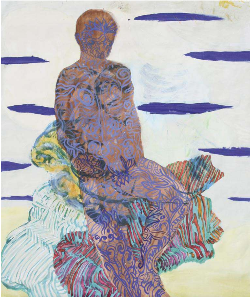
Sedent, 1992 Acrílico sobre papel, 166 x 140 cm