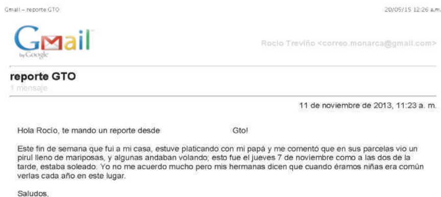
Figura 6 Texto de reporte 4

contenida nos dice más sobre las condiciones de producción de los datos que sobre la migración de la mariposa monarca.