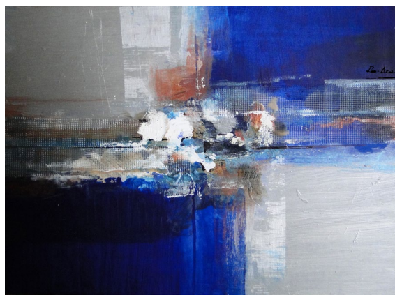
Título: Azul ultramar Técnica: Técnica mista Dimensões: 49 x 68 cm 2023