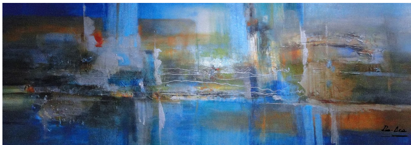
Título: Atmósfera en azul Técnica: Técnica mista Dimensões: 65 x 175 cm 2023