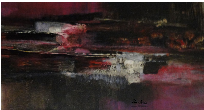
Título: Destino 4 Técnica: Técnica mista Dimensões: 40 x 70 cm 2019