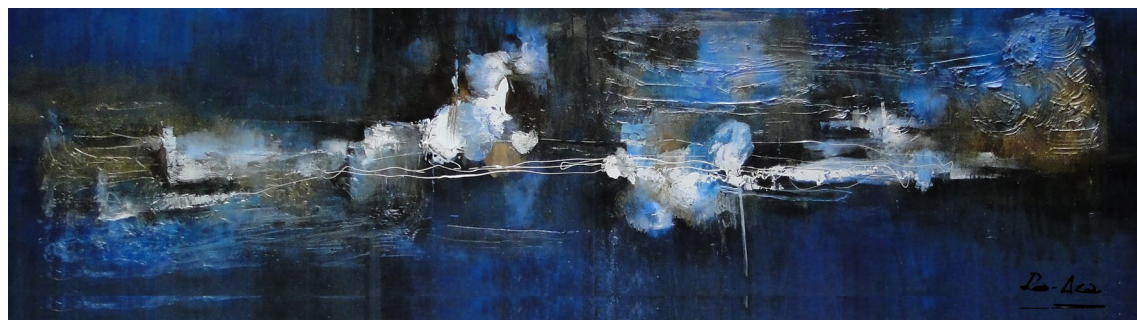
Título: Catarsis en azul Técnica: Técnica mista Dimensões: 80 x 280 cm 2021