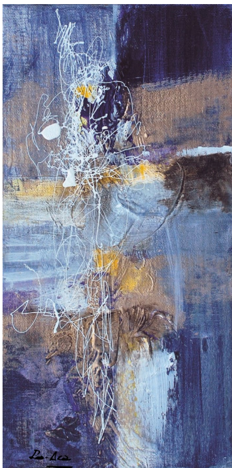
Título: Gracia 12 Técnica: Técnica mista Dimensões: 30 x 15 cm 2013