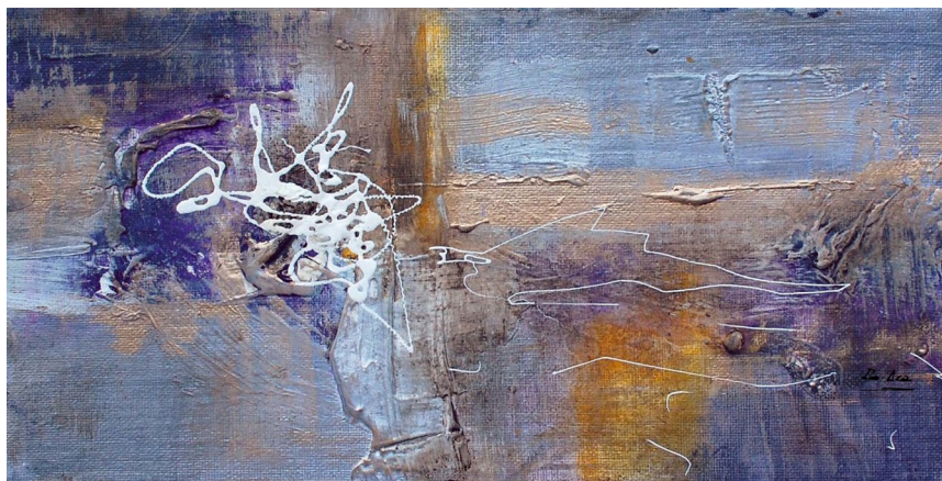
Título: Gracia 1 Técnica: Técnica mista Dimensões: 15 x 30 2013