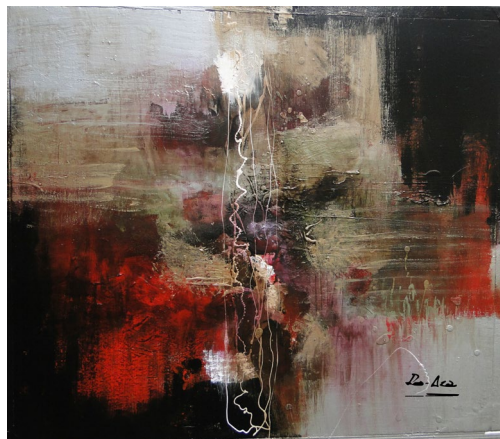
Título: Ninfas Técnica: Técnica mista Dimensões: 57 x 57 cm 2016