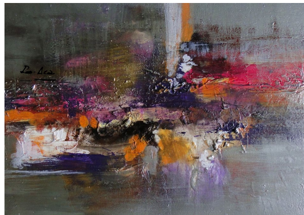
Título: Destello Técnica: Técnica mista Dimensões: 30 x 70 cm 2013