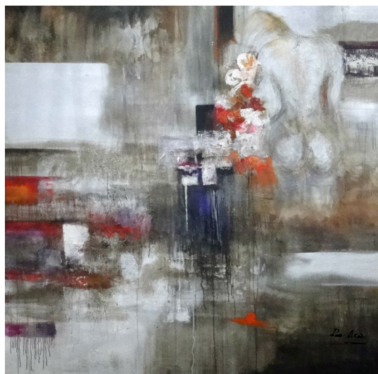
Título: Génesis Técnica: Técnica mista Dimensões: 115 x 115 cm 2018