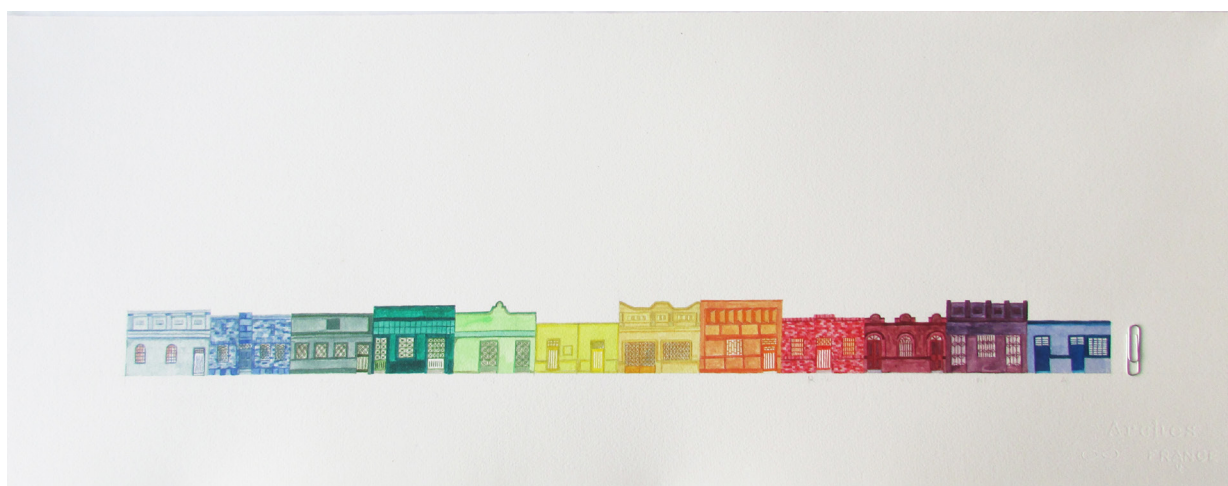
Título: Barrio 7 de agosto (serie Archivo sensible de arquitectura bogotana en vía de extinción ) Técnica: Acuarela sobre papel Dimensiones: 25 x 70 cm 2016