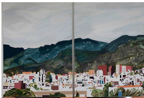
Título: Cerros orientales desde la Universidad Nacional de Colombia Técnica: Vinilo y acrílico sobre lienzo Dimensiones: 170 x 220 cm 2024