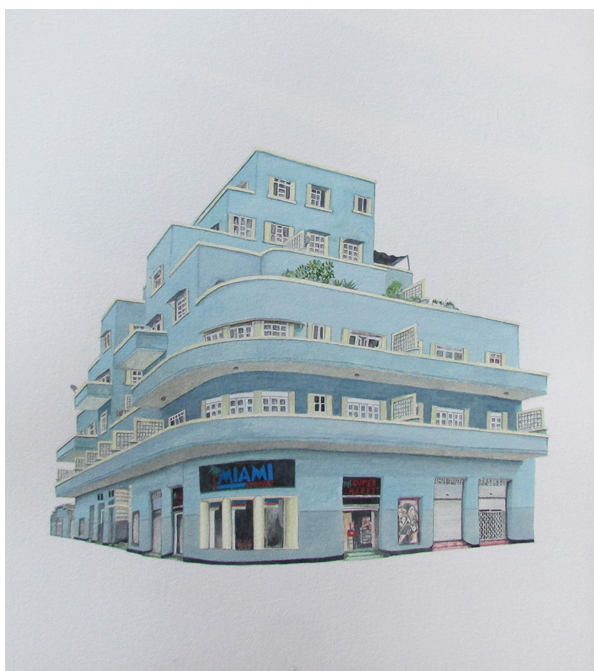
Título: Edificio García Barranquilla Técnica: Acuarela sobre papel Dimensiones: 70 x 50 cm 2018