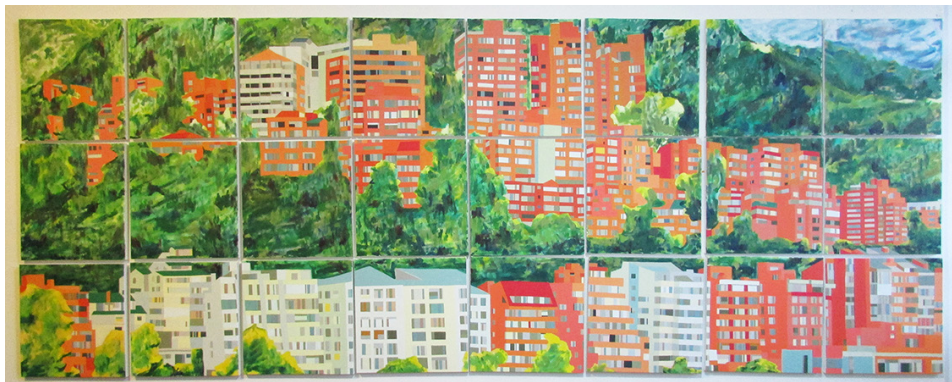
Título: La cabrera (serie Lo humano de la montaña ) Técnica: Acrílico sobre lienzo Dimensiones: 150 x 400 cm 2017