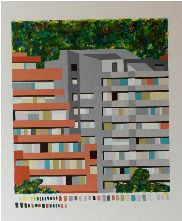
Título: Calle 85 (serie Lo humano de la montaña ) Técnica: Acrílico sobre lienzo Dimensiones: 60 x 50 cm 2023