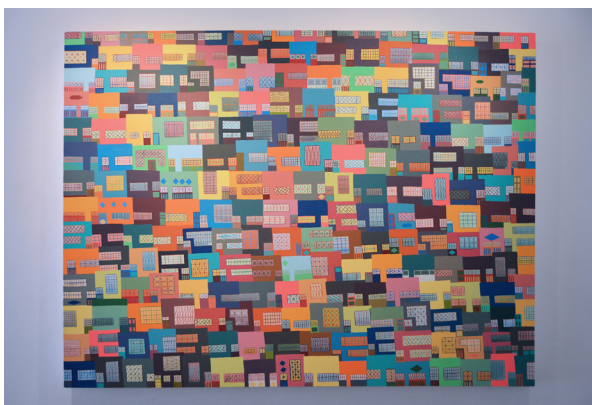
Título: Paisajes hechos a mano Técnica: Acrílicos sobre lienzo Dimensiones: 130 x 170 cm 2016