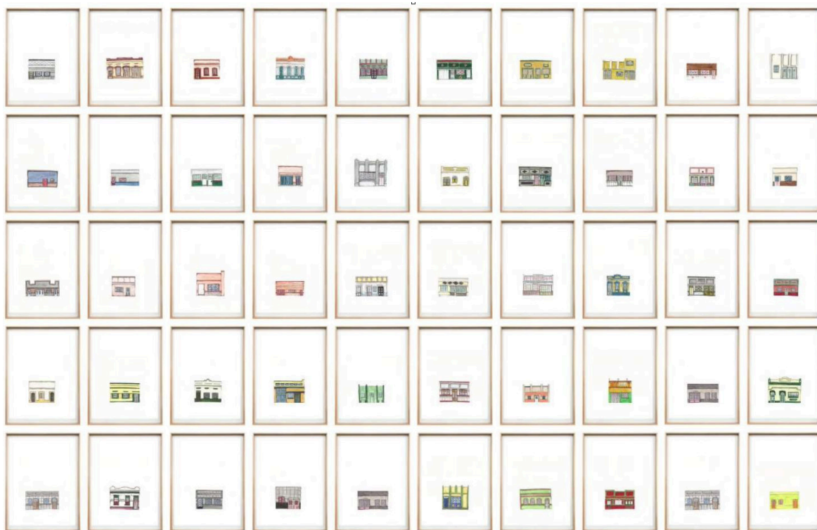
Título: Archivo sensible de arquitectura bogotana en vía de extinción Técnica: Acuarela sobre papel Dimensiones: 18 x 13 cm 2015 - 2024