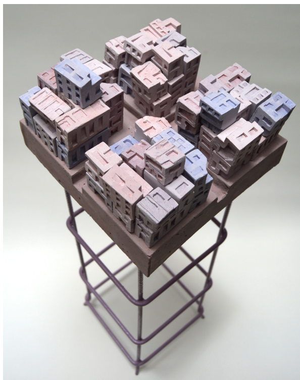
Título: Construcciones cromáticas Técnica: Cemento y yeso tinturado, varilla metálica pintada con esmalte industrial Dimensiones: 85 x 28 x 28 cm 2014 - 2015