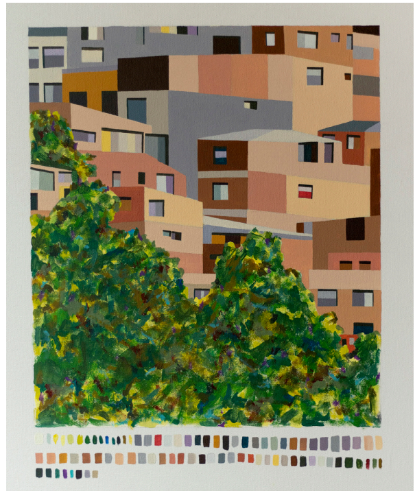
Título: Cerro del cable (serie Lo humano de la montaña ) Técnica: Acrílico sobre lienzo Dimensiones: 60 x 50 cm 2023