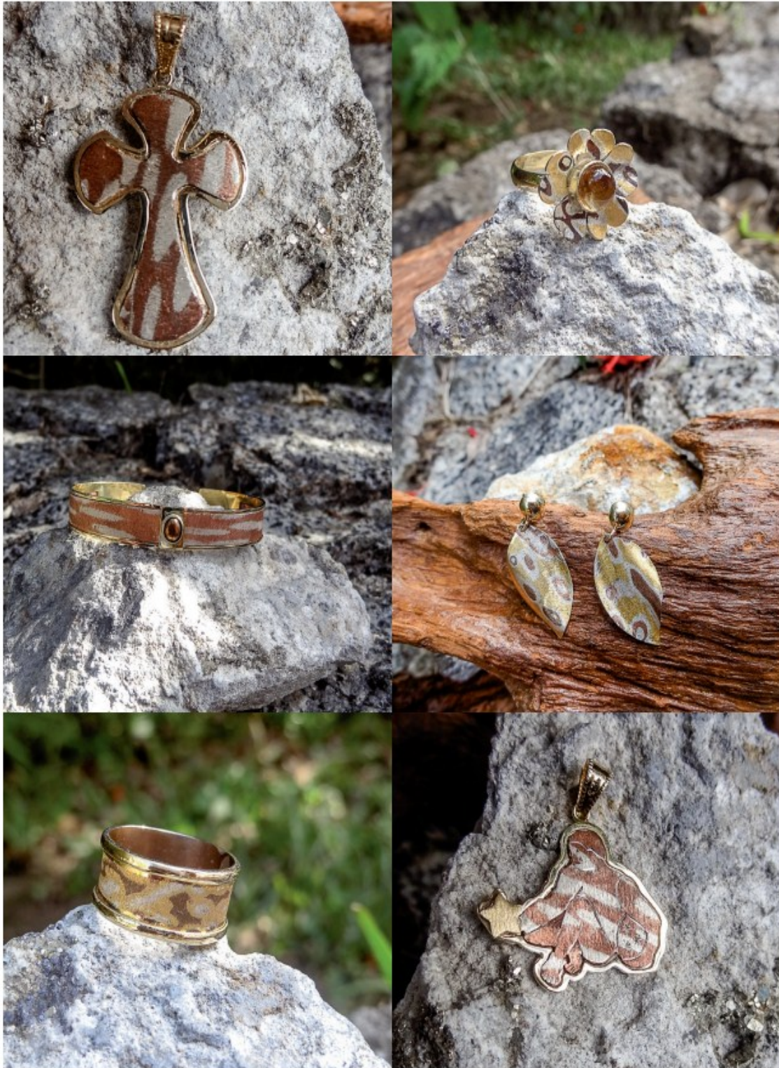
Figura 4. Prototipos de Mokume-gane elaborados por joyeros de Medellín, obtenidos de bloques soldados por difusión en los laboratorios de la Universidad de Antioquia.