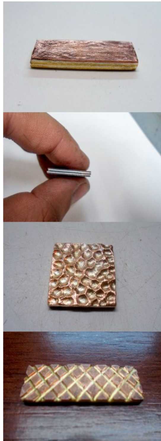
Figura 3. Bloques de metales oro-plata-cobre obtenidos por difusión, deformados y con los jaspeados correspondientes, listos para elaborar las piezas de joyería.

En el control difusional para la técnica Mokume-gane fueron utilizados varios de los principios matemáticos, tales como: la segunda ley de Fick para flujos no estacionarios, la ecuación de Arrhenius, el efecto de Kirkendall y el análisis de Darken. Estos principios tratan sobre la variación del coeficiente de difusión con la temperatura y la concentración y la diferencia del flujo de átomos de un metal a otro. Se encontró que estos se ajustaron perfectamente en este trabajo experimental, obteniéndose muy buenos resultados. Es decir, se logró una soldadura perfecta por difusión de las diferentes láminas (ver figura 3), lo que permitió la elaboración de una muestra variopinta de prototipos únicos e innovadores, incluyendo un girasol con gema exótica de oro de colores (figura 4). Adicionalmente se presenta un ensayo SEM-EDS para el sistema cobre, plata, oro, cobre, obtenido por difusión (figura 5).