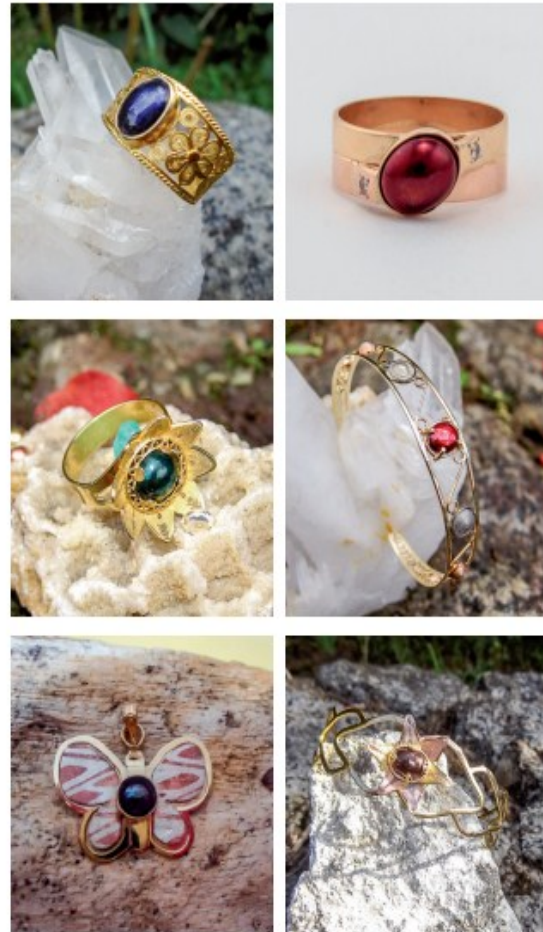
Figura 1. Gemas de oro azul zafiro, rojo, verde, fucsia, azul cobalto y magenta, obtenidos por capas de óxido superficial en los laboratorios de la Universidad de Antioquia, engastados en prototipos elaborados por joyeros de Santa Fe de Antioquia y Medellín.

Mediante los diferentes tratamientos termoquímicos de difusión se obtuvo un hermoso abanico de gemas de oro de colores exóticos como azul, fucsia, verde, morado, rojo, magenta, que fueron engastadas en preciosas joyas de filigrana y de diseño liso, como se muestra en la figura 1.