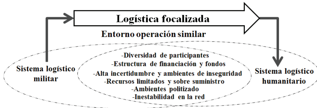
Figura 3 Elementos comunes entre los entornos de operación de los sistemas logísticos militar y humanitario

Actualmente la proyección de la fuerza conjunta está caracterizada por ser lineal, centralizada y secuencial, en el futuro se caracterizará por ser simultánea, descentralizada y distribuida.