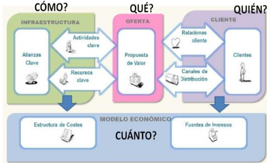
Figura 1. Modelo de negocios de Canvas.

La Propuesta de valor también se le conoce como Oferta de valor diferenciada, la Corporación Calidad la define como: “Una propuesta claramente diferenciada, difícilmente imitable, percibida y apreciada por los clientes o grupos sociales objetivo, porque les agrega valor para su éxito y desarrollo...”