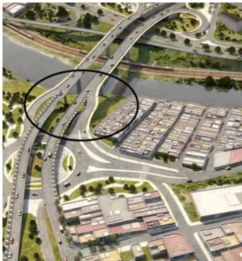
Planos puente Madre Laura. El círculo indica la ubicación de Puerto Nuevo

Es de resaltar que desde hace años estaban alertados por la experiencia de barrios como el morro de Moravia y desde inicios de adquisición de predios -hace 2 años- se exigió un plan parcial o de reasentamiento en sitio, pues no se puede derribar “una malla social” que ha echado raíces “alrededor de la cooperativa de recicladores” porque “aquí están nuestros padres, nosotros y los nietos”.