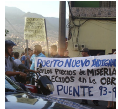
Pancartas en el plantón y bloqueo vía regional. Febrero de 2013