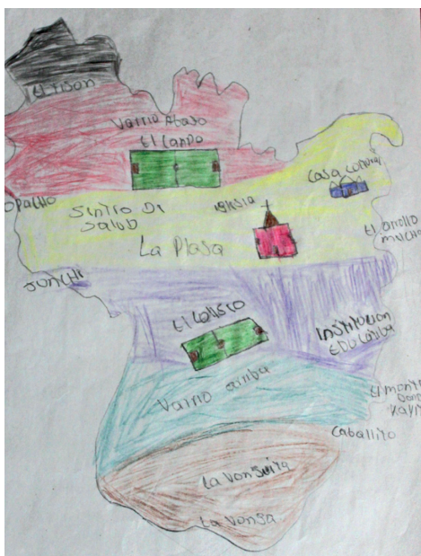
Imagen 01: Mapa producido en los talleres de cartografía social con los y las estudiantes de la Institución Educativa Técnico Agropecuaria Benkos Biohó.

y movimientos afrocolombianos. Esta carta legal reconoce los derechos de las “comunidades negras” a través del artículo transitorio número 55, el cual da lugar a la Ley 70 de 1993, que a su vez, es otro marco legal importante en la comprensión de este escenario (Wabgou et. al., 2012). Estas leyes se dan como repuesta a la necesidad de reconocer diferentes culturas étnicas y, por consecuencia, las diferentes formas de concebir el mundo y las relaciones sociales. Es decir, promover la multiculturalidad y la pluriétnicidad como principios del pluralismo jurídico. Al mismo tiempo, es un manera de inducir a la población a no pensar las diferencias culturales por medio de invisibilidad-estereotipia (Friedemann, 1984).